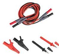
Juego de cables para medir la tensión