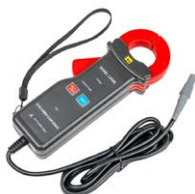
Pinza de medición C-130BE