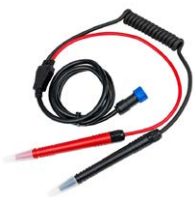
Juego de cables para medir la impedancia interna